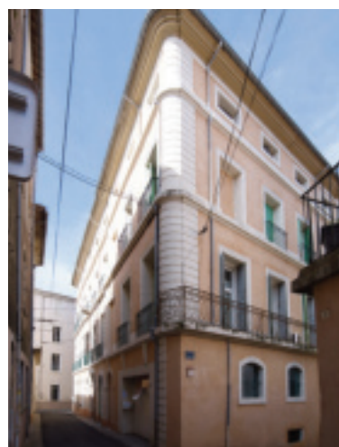
Fig. 22. Bédarieux (Hérault), manufacture Fabregat ; rue Courbezou.