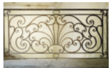
Fig. 25. Clermont-l'Hérault (Hérault), grand escalier de la manufacture Raissac.