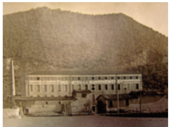
Fig. 40. Bédarieux (Hérault), usine Donnadille, au sud de la ville, détruite par un incendie.