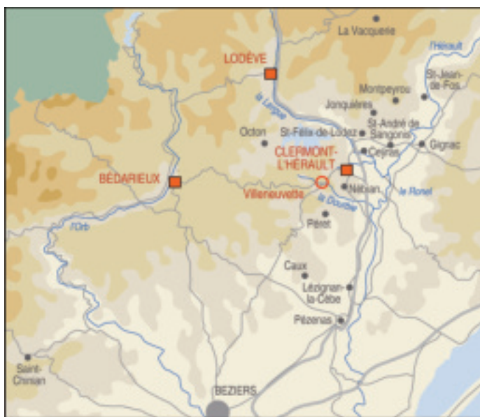
Fig. 5. Territoire du Lodévois, du Clermontais et du Béderrès. Véronique Marill © Région Languedoc-Roussillon, Inventaire général.

Pour le Lodévois, Clermontais et Béderrès, les sources écrites témoignent de l'existence d'un lien productif entre ville et campagne, encadré par le pouvoir royal et dominé par les marchands-fabricants installés dans les agglomérations. Ainsi, selon une ordonnance royale de 1722, les fabricants de Lodève sont autorisés à faire travailler dans tous les villages et hameaux de la Montagne 42 . À la même époque, les 19 marchands-fabricants de Clermont-l'Hérault font travailler dans le ressort de la ville 160 métiers produisant 1750 draps londrins seconds alors que les londres larges sont élaborées dans 21 villages voisins 43 . Même la manufacture concentrée de Villeneuve associe travail salarié et travail à façon distribué dans les campagnes alentour 44 (fig.5). Ces exemples tendent à montrer qu'il existe une répartition des tâches, entre ville et campagne, en fonction des opérations et des produits fabriqués. Pour Jean-Michel Minovez, qui privilégie les relations entre négoce et fabrication pour définir