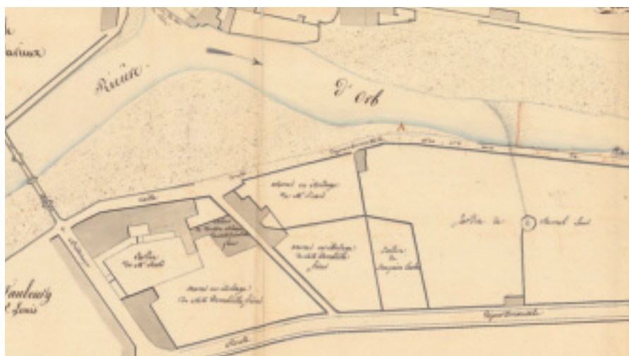
Fig. 38. Bédarieux (Hérault), détail d'un plan relatif à une demande d'installation d'usine présentée par MM. Jean et Vital Aphrodise Donnadille, 1834. © Archives départementales de l'Hérault (France), 7 S 159.