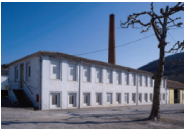
Fig. 44. Lodève (Hérault), usine Vitalis.