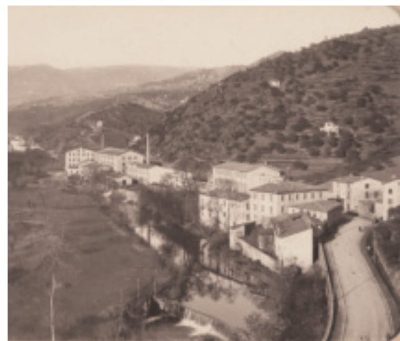
Fig. 42. Lodève (Hérault), usines textiles en amont de la ville ; rive gauche de la Lergue, 1898 (archives privées). Marc Kérignard © Région Languedoc-Roussillon, Inventaire général.

Les établissements industriels qui s'égrainent le long de l'Orb, du Vèbres, du Rhonel, de la Lergue et de la Soulandres sont des bâtiments massifs, construits sur un plan rectangulaire (fig.42). Pouvant comporter jusqu'à cinq niveaux, dont plusieurs étages en soubassement pour compenser l'encaissement des cours d'eau, ils sont qualifiés d'« usine à étages » 190 . Leurs murs gouttereaux sont percés d'ouvertures nombreuses et régulières, chaque baie étant associée à une rangée de machines. La morphologie de l'usine à étages est liée au système de transmission de la force hydraulique, mettant en jeu un axe vertical entraînant, à chaque étage, un arbre horizontal muni de poulies reliées aux machines par des courroies de transmission. Les aménagements hydrauliques