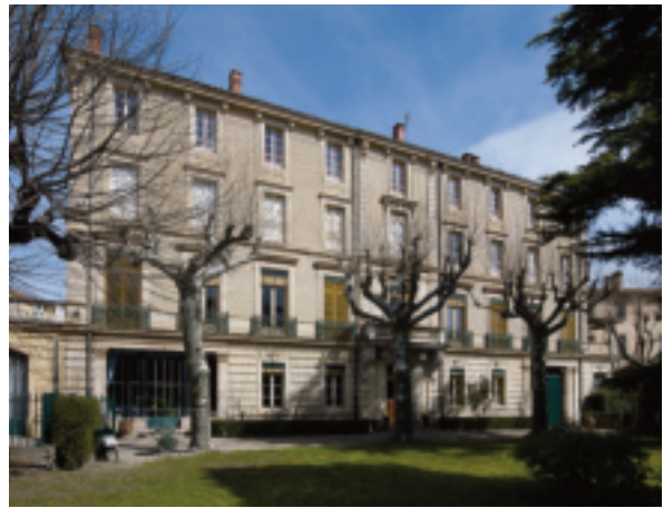
Fig. 39. Bédarieux (Hérault), fabrique Donnadille, devenue maison patronale dans les années 1890.

Enregistrée en tant que « maison de fabrique » dans les matrices cadastrales, il est vraisemblable qu'elle ait abrité des métiers pour la production de draps. Lors de la vente des biens de la famille Donnadille en 1882, la maison dite « maison Neuve » - un incendie ayant entraîné la reconstruction du bâtiment vers 1870 171 - comprend trois étages sur rez-de-chaussée [...] avec ses dépendances et appartenances, qui consistent en deux terrasses, deux cours, un jardin, une serre et dépendances et une écurie située au fond de la cour septentrionale [...]. La maison principale a ses entrées sur la cour au passage qui est au devant du jardin 172 . Alors que l'ensemble est passé aux mains de Pierre Donnadille, ce dernier s'adresse à l'agence Carlier, en 1892, afin de modifier les appartements 173 . Après travaux, le rez-de-chaussée est réservé aux pièces de service et le premier étage aux appartements. Les deuxième et troisième étages sont occupés par des magasins pour les laines teintes et les draps. Ce cas exemplaire montre combien la reconversion des bâtiments de l'industrie est aisée à cette époque : l'usage ne déterminant pas encore la forme, la fabrique des frères Donnadille est devenue une élégante et prestigieuse maison patronale (fig.39).