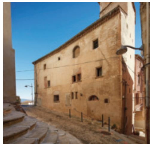
Fig. 6. Clermont-l'Hérault (Hérault), façade occidentale de la maison Baille.

La teinture des laines ou des draps exige à la fois un haut niveau de qualification et un capital fixe important 58 . À Clermont-l'Hérault, Lodève et Bédarieux, les teintureries sont presque exclusivement situées dans les faubourgs, faubourg de la Frégère à Clermont 59 , faubourgs de Montbrun et d'Al Ban à Lodève 60 , faubourgs du Pont (Saint-Louis), du Vignal et de Trouseau à Bédarieux 61 . Nous n'avons retrouvé aucune mention de ces installations dans les écartes,