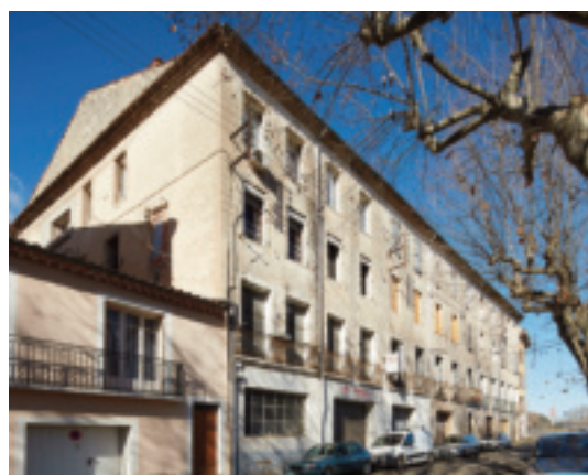
Fig. 41. Bédarieux, usine Sicard, place Pasteur.