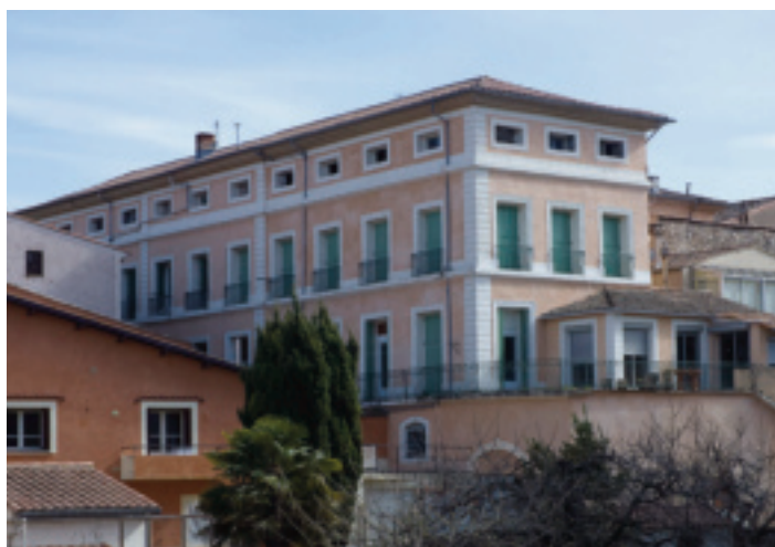
Fig. 21. Bédarieux (Hérault), manufacture Fabregat depuis l'ouest.