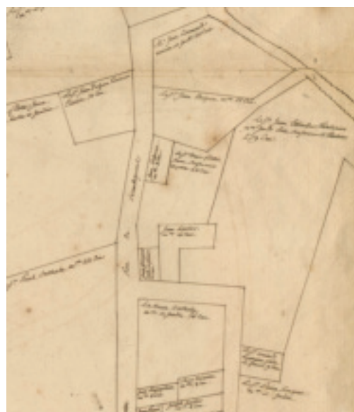
Fig. 11. Clermont-l'Hérault (Hérault), plan du fief Daussatières ; détail de la rue de Boubequiol, actuelle rue de l'Égalité, XVIII e siècle (AM Clermont-l'Hérault, CC 12).

En 1708, le marchand-fabricant clermontais, Antoine Raissac, fait construire au faubourg de la Frégère, une maison à faire tinture , première manufacture dont la localisation, la nature et la date de construction peuvent être établies avec certitude, en dehors de la manufacture de Villeneuve 83 . Elle participe assurément au mouvement de concentration de la production dans des édifices construits à cet effet, phénomène qui s'amplifie après les années 1710. En 1715, le Conseil d'État délivre aux fabricants de Clermont-l'Hérault le privilège de travailler pour le Levant 84 . Ils sont alors autorisés à confectionner des londrins seconds, au même titre que les manufactures royales et les villes de Carcassonne et de Saint-Chinian 85 . Comme le rappelle Tihomir J. Markovitch, la réussite de ces initiatives privées se confirme dans les années 1730, époque où elles ont eu tendance à supplanter la manufacture royale par une croissance supérieure 86 . Au cours de cette période, d'après les