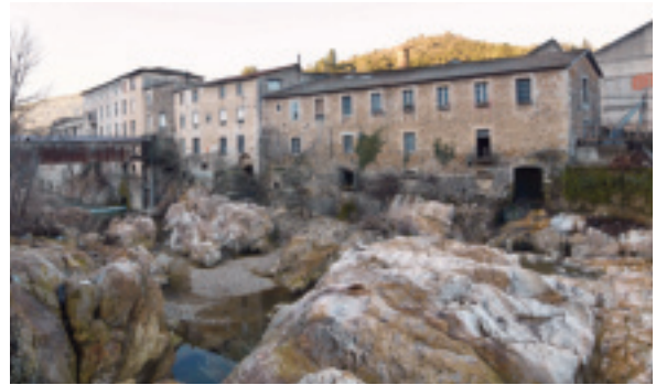
Fig. 9. « Vieux foulons sur la Lergue, d'après une sanguine de B. Roger ». © Archives départementales de l'Hérault (France), 9 Fi 297.