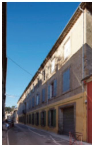
Fig. 33. Clermont-l'Hérault, (Hérault), plan représentant l'atelier de filature de MM. Planque, Siau, Gaussin et Delpon; rue Saint Dominique, 1838.