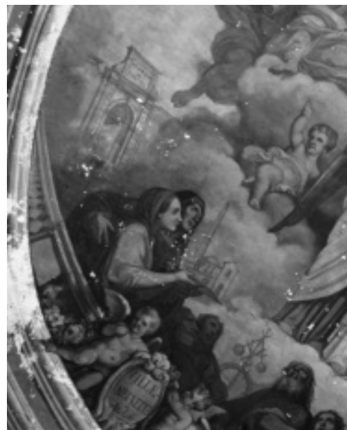
Fig. 35. Villeneuve (Hérault), décor de la chapelle, daté de 1871 et signé du peintre D. Pauthe. Michel Descossy © Région Languedoc-Roussillon, Inventaire général.

À Bédarieux, les établissements Donnadille s'équipent de machines à vapeur au début des années 1870 163 . À la même époque, la moitié de la force motrice de Lodève, évaluée à plus de 1000 chevaux, est fournie par des machines à vapeur. Néanmoins, le moteur thermique reste très souvent un moteur d'appoint, utilisé notamment pendant les périodes de sécheresse ou d'inondations. Rappelons que les cheminées d'usines, qui se multiplient alors dans le paysage du Lodévois, du Clermontais et du Béderrès, ne signalent pas toutes l'adoption d'une machine à vapeur. Elles sont très souvent liées à l'existence d'une chaudière utilisée pour chauffer les cuves de teinture, les cylindres d'apprêts ou l'air pour le séchage de la laine 164 . Ainsi, Camille Saintpierre affirme que le département dispose, en 1865, de 240 chaudières motrices ou calorifères. Sur ce nombre, 119 sont destinées uniquement au chauffage, dans des établissements industriels 165 .