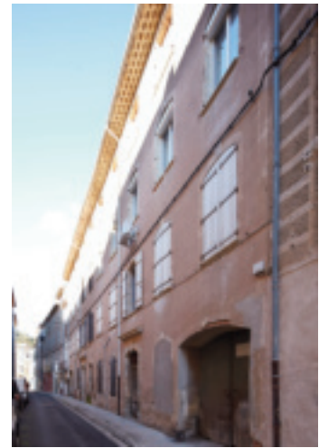
Fig. 24. Bédarieux (Hérault), immeuble rue du Fer, peut-être manufacture de draps au XVIII e siècle.