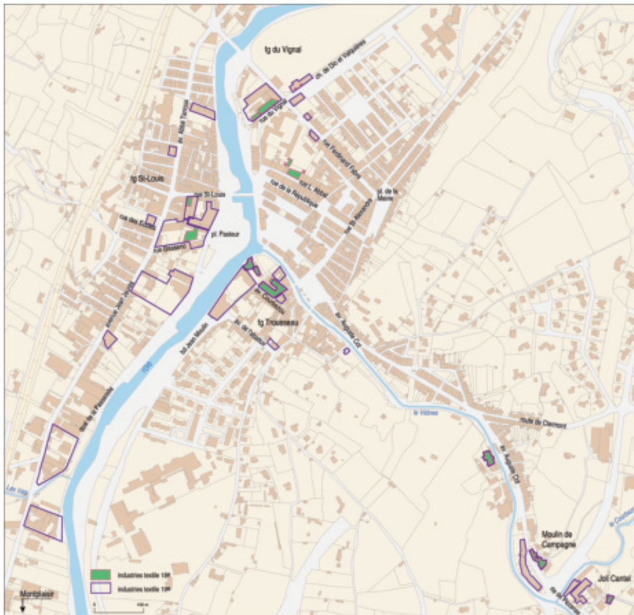
Fig. 36. Bédarieux, plan de localisation des usines textiles attestées aux XVIII e et XIX e siècles. Véronique Marill © Région Languedoc-Roussillon, Inventaire général.