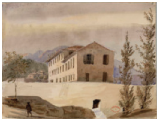
Fig. 29. Aquarelle de Jean-Marie Amelin, probablement la filature Causse de Bédarieux, 1822. © Médiathèque centrale d'Agglomération Emile Zola, Montpellier, 1652RES_Vol9_030.

La mécanisation débute à Bédarieux avec l'installation des premiers équipements dédiés à la filature des laines, dès le début des années 1810 141 . En 1813, il existe déjà 32 filatures par mécanique à Bédarieux, alors que Lodève n'en compte que 5 142 . Les fabricants Pierre Martel, Verny et Gaston, Antoine Causse, Prades et Grand frères, Amefield et Jean Begalou 143 , et Joseph Maistre à Villeneuve 144 ,