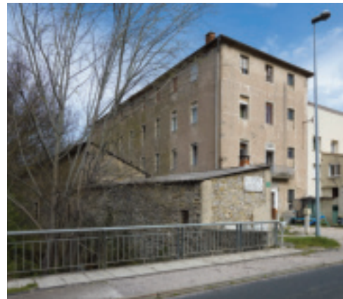
Fig. 30. Bédarieux (Hérault), détail d'un plan représentant les usines Causse, 1859.