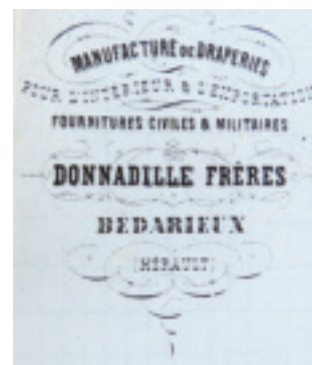
Fig. 37. Bédarieux (Hérault), papier à en-tête des établissements Donnadille Frères, 1865.