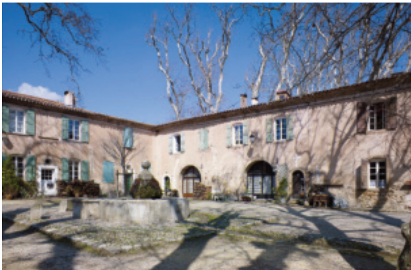
Fig. 27. Villeneuvevrette (Hérault), logements et magasins de l'ancienne manufacture royale ; place Louis XIV.

passés par Conques ou Carcassonne 122 . Les bâtiments de la manufacture royale de Villeneuvevrette sont commandités par le marchand Pierre Baille en 1675, puis par la société Pouget à laquelle succèdent l'entrepreneur carcassonnais Guillaume Castanier d'Auriac et son fils 123 . Si le tracé géométrique de l'ensemble témoigne d'une conception préalable 124 , on ne connaît pas, en effet, l'auteur du plan. On soupçonne un maître d'oeuvre (peut-être un ingénieur ?), soucieux d'efficacité qui a cherché à créer une architecture fonctionnelle et systématique, tout en utilisant les techniques locales de construction et de décor. Les dispositions intérieures des maisons, les éléments de décor (calade à motif géométrique, enduits, épis de faîtage en céramique, ferronnerie) sont fréquents dans les villages du canton et de la moyenne vallée de l'Hérault 125 (fig.26, 27). Il existe donc bien une unité, à la fois historique, technique et architecturale, aussi bien à l'échelle locale entre la manufacture de Villeneuvevrette et les manufactures des villes voisines, qu'au-delà, à l'échelle nationale.