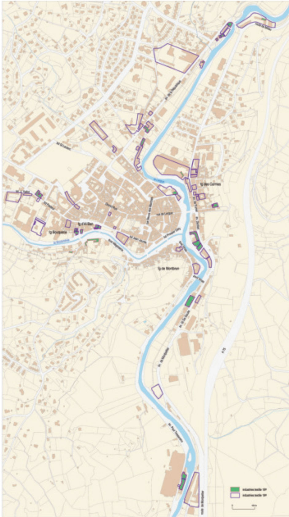
Fig. 28. Lodève, plan de localisation des usines textiles attestées aux XVIII e et XIX e siècles. Véronique Marill © Région Languedoc-Roussillon, Inventaire général.