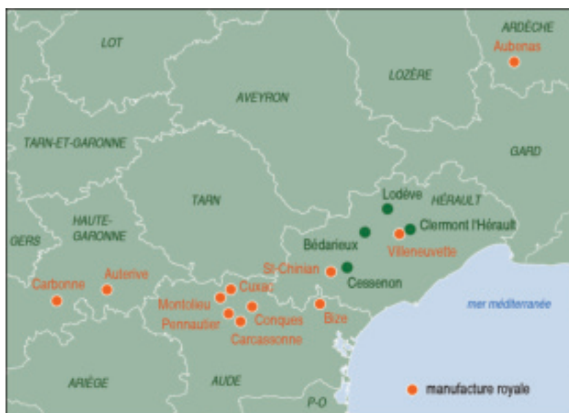
Fig. 1. Les manufactures royales du Languedoc.

En Languedoc, les manufactures royales de draps, au nombre de 12 10 (fig.1), ont longtemps concentré les recherches, comme aujourd'hui les moyens mis en œuvre pour la conservation et la valorisation de ce patrimoine industriel monumental 11 . À la suite de Claude Marquié, rappelons qu'elles ne représentent pourtant qu'une part minoritaire, environ 15 % de la production de draps en Languedoc 12 . Quelle a été la place de Villeneuveville, manufacture royale située au cœur du territoire étudié, dans le tissu économique du Lodévois, du Clermontais et du Béderrès 13 ? Quelles ont été ses influences sur les modes d'organisation de la production textile dans cet espace géographique ? Le projet exigeait d'établir une liste des établissements attestés au XVII e siècle. Nous en proposons une première classification issue de travaux foisonnants, d'où un rapide bilan historiographique, et d'un dépouillement inédit des sources fiscales.