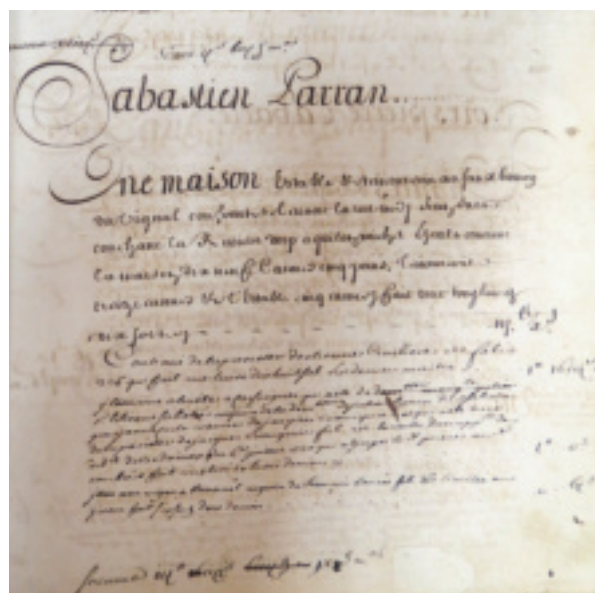
Fig. 2. Bédarieux (Hérault), article du compoix de 1685 (AM Bédarieux. CC 6).

Dans ce pays de « taille réelle » où l'impôt porte sur les biens, les compoix (fig.2), ces registres contenant la liste des biens des contribuables, renferment plusieurs informations