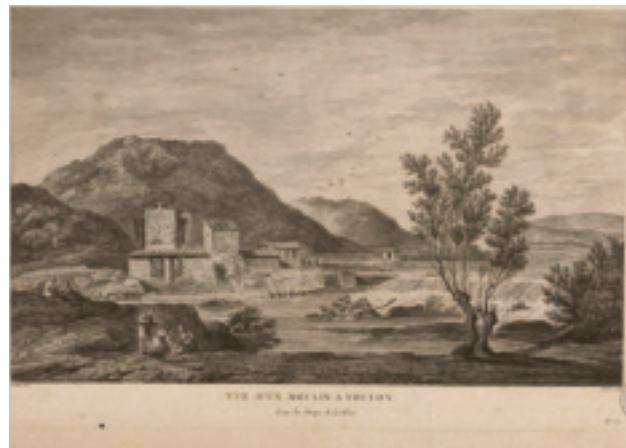
Fig. 8. Estampe d'un moulin à foulon pour les draps de Lodève, devenu l'usine dite du Bouldou; dessin de Genillon, gravure d'Aveline en 1775. © Archives départementales de l'Hérault (France), 9 Fi 12.