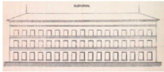
Fig. 45. « Plan des ateliers et des usines dont se compose la manufacture de draps » du pétitionnaire, extrait d'un cahier des charges pour l'adjudication de la fourniture des étoffes de laine à l'habillement des troupes de terre et de mer, 1864.

Le standard architectural de l'usine du XIX e siècle, en Lodévois-Clermontais-Béderrès, s'apparente à l'« architecture industrielle fonctionnelle » : la forme est directement induite par la fonction et répond aux contraintes engendrées par le type de production 193 . À partir de l'étude des matrices cadastrales et d'une analyse in situ menée à Lodève, Clermont-l'Hérault et Bédarieux, nous avons identifié 49 usines à étage, édifiées entre 1810 et 1880. Au-delà des contraintes techniques et de la recherche de fonctionnalité qui expliquent le développement de ce type d'architecture industrielle, l'uniformité des usines textiles soulève une fois encore la question des modèles. Tandis que