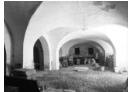
Fig. 19. Villeneuve (Hérault), magasin au rez-de-chaussée de la maison de maître. Michel Descossy © Région Languedoc-Roussillon, Inventaire général.

Le bâtiment en front de rue, de deux à trois étages, possède très souvent une façade soignée, ordonnancée, offrant à voir la réussite du marchand-facteur. À Clermont-l'Hérault, la manufacture édifée par Antoine Raissac, en 1708, présente ainsi un front bâti continu, d'une longueur de 50 mètres environ. Les étages sont dévolus au logis, tandis que les vastes espaces en rez-de-chaussée, couverts de voûtes d'arêtes, servent de magasins de stockage, semblables à ceux de Villeneuve (fig.19). Le corps central est prolongé par des ailes en retour, de plus petites dimensions. Réservées aux unités de