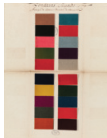
Fig. 3 et 4. Échantillons de londrins seconds de fabricants de Clermont-l'Hérault.