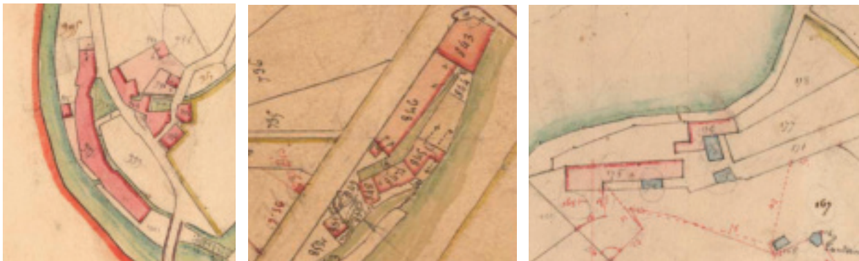
Fig. 13. Bédarieux (Hérault), « Moulin de Campagne » ; détail du plan cadastral de 1826. © Archives départementales de l'Hérault (France), 3 P 3456.