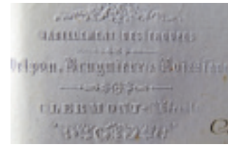
Fig. 32. Clermont-l'Hérault (Hérault), papier à en-tête de la société Delpon, Bru-guière et Boissière, 1865.

importantes de Lodève, l'outillage se compose d'environ 400 machines cardes ou drousses, de 800 métiers à tisser mécaniques, de plus de 150 fouleuses mécaniques. Le nombre des broches 152 des mull jenny doit dépasser d'après nos calculs 35 000 153 . À Clermont-l'Hérault, les 7 usines de la ville comptent 6 000 broches, 121 métiers mécaniques et 164 à bras 154 (fig.33, 34). Quant à Bédarieux, les 15 filatures représentent un ensemble d'environ 13 000 broches, tandis que ses manufactures utilisent encore 280 métiers à bras et 76 seulement à la mécanique 155 . Ces chiffres, avancés par l'auteur afin de souligner la mécanisation des équipements industriels 156 , révèlent également le maintien d'un grand nombre de métiers à bras dans les usines.