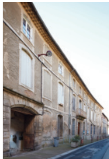
Fig. 20. Clermont-l'Hérault (Hérault), manufacture Raissac ; rue de la Frégère.

Si dix manufactures peuvent être rattachées à l'archétype de la grande manufacture sur cour, les trois plus beaux exemples de cette architecture industrielle se trouvent à Clermont-l'Hérault, rue de la Frégère (fig.20) et à Bédarieux (fig.21, 22) au faubourg Trouseau, rue Courbezou 108 . Ce dernier exemple est particulièrement intéressant car nous en connaissons à la fois le maître d'ouvrage et le maître d'œuvre. La manufacture dite Fabregat est construite sur un terrain acquis en 1755, par le corps des fabricants de Bédarieux, qui fait venir un maître teinturier pour dresser le plan de la construction, faire le choix d'un local commode et propre avec usage soit pour la teinturerie, soit pour placer les presses et rames et autres outils nécessaire 109 . Alors que l'identification d'un architecte, auteur du projet de construction des grandes manufactures, est exceptionnelle et, le plus souvent hypothétique 110 , cette mention en éclaire la conception. À Bédarieux, elle est l'œuvre d'un