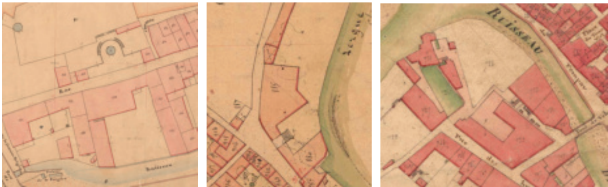
Fig. 16. Clermont-l'Hérault (Hérault), rue de la Frégère ; détail du plan cadastral de 1836. © Archives départementales de l'Hérault (France) 3 P 3507.

Le second type de fabriques 105 concerne des constructions ex nihilo, à l'initiative de marchands-facturiers. Ces édifices, regroupant magasins 106 , ateliers de teinturerie et d'apprêts, sont installés dans les espaces urbains restés vacants, dans les faubourgs ouest de Clermont-l'Hérault (faubourg de la Frégère), dans les faubourgs nord (rue du Fer, actuelle rue Louis Abbal) et sud (faubourg Trousseau) de Bédarieux et, vraisemblablement, aux marges des faubourgs des Carmes, de la Bouquerie et d'Al Ban à Lodève. Respectant le parcellaire existant, les manufactures sont implantées sur de vastes parcelles rectangulaires, bordant un cours d'eau, telle la manufacture Seimandy : les bâtiments qui servaient à cette manufacture sont vastes, commodes, fournis de tout ce qui est nécessaire et près de la petite rivière qui baigne les murs de la ville 107 . Construits en limites de parcelle, les édifices forment un espace clos autour d'une cour centrale (fig.16, 17, 18).