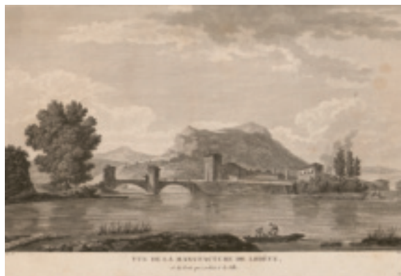
Fig. 12. Estampe de la manufacture de Lodève ; dessin de Genillon, gravure d'Aveline en 1775. © Archives départementales de l'Hérault (France), 9 Fi 9.